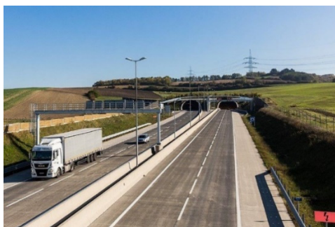
Frühjahrsputz im Tunnel Tradenberg an der A5/S1